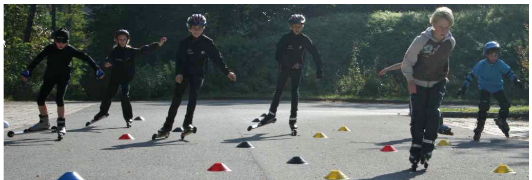
Das Kinderkader beim Erlernen der Grundtechniken

Für die Kinder ist neben dem spielerischen Erlernen der Techniken die Teilnahme am NÖ-Kidy-Cup das Ziel.