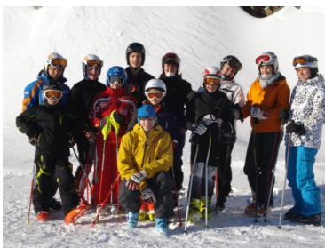
Die Teilnehmer der 1. SVg Hohe Wand auf dem Kitzsteinhorn