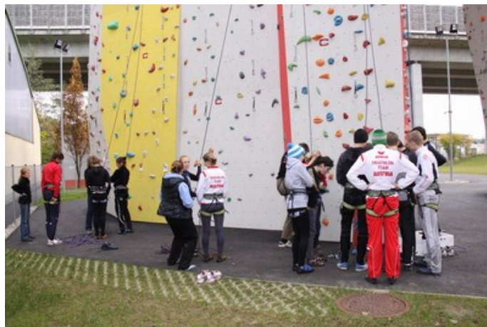
Die Kursteilnehmer beim Schwimmtraining und in der Kletterhalle