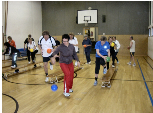
Fleißig wird an der Beweglichkeit und Koordination von Frau und Mann geübt.

„Jeden Montag um 19:00 Uhr in der Turnhalle VS Stollhof “